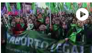
Ovazione in piazza a Buenos Aires per il sì all'aborto