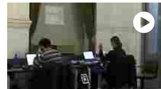
Ansaldo Energia e industria 4.0: capitale umano resta al centro