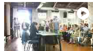
Portierato sociale: a Roma al via un aiuto per gli anziani soli