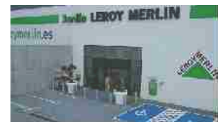
Leroy Merlin Spagna, un format solo giardino 2019-03-13 In "Estero"