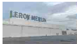
Leroy Merlin, apertura ad Ancona in primavera 2021-01-29 In "Distribuzione"