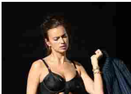
Wanda, Diletta e... le foto delle Vip