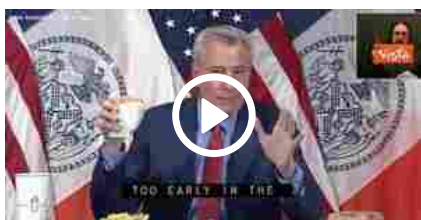
Usa, il sindaco di New York De Blasio offre patatine fritte a chi si vaccina