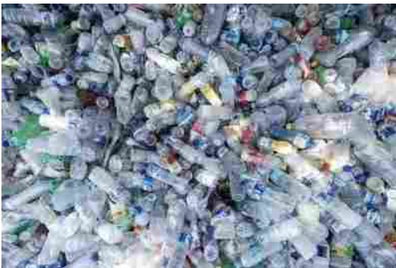
Coripet, eco-compattatori nei negozi Leroy Merlin