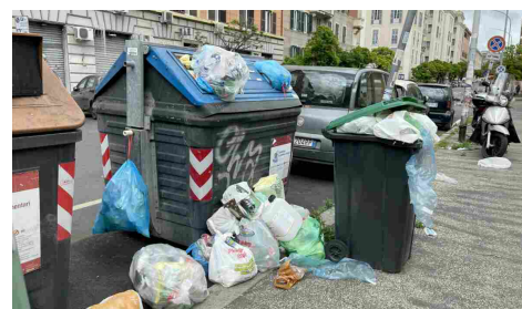
Gestione rifiuti Roma, al Tar del Lazio Raggi la spunta su Zingaretti