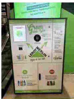
Ecocompattatore Leroy Merlin

Il meccanismo di raccolta è associato al programma di fedeltà Leroy Merlin, Ideapiù : i clienti, dopo aver scaricato l'app Coripet e compilato, oltre ai propri dati personali, il codice di 17 cifre della propria carta Ideapiù, potranno accedere all'ecocompattatore e inserire le bottiglie, che dovranno essere vuote, non schiacciate, con tappo, etichetta e codice a barre leggibile. Per ogni bottiglia donata, i clienti guadagneranno 1 punto . Raggiunta la soglia dei 150 punti, i clienti troveranno sulla app Leroy Merlin un coupon di 10 euro per i possessori di carta Ideapiù Easy e di 15 euro per i clienti Ideapiù Premium e Ideapiù Professional su una spesa minima di 50 euro.