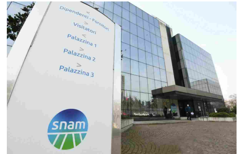
Efficienza energetica, accordo da 150 mln tra Snam e Bei