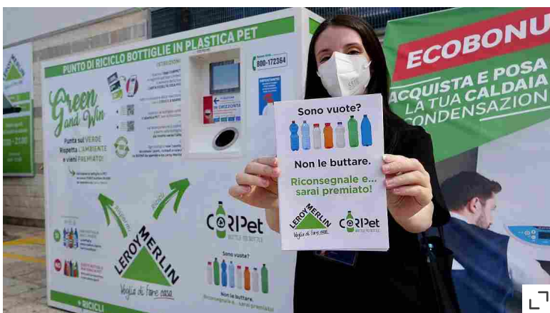
▲ L'ecocompattatore di Leroy Merlin, ma ne sono in arrivo due comunali