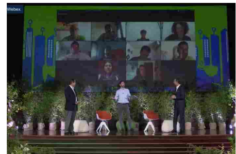
SostenibilitÃ, Cisco: ecco i vincitori della Green&Blue Smart Marathon