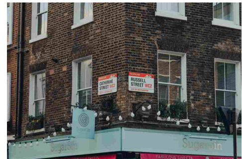
Streetonomics, i segreti del nome delle vie