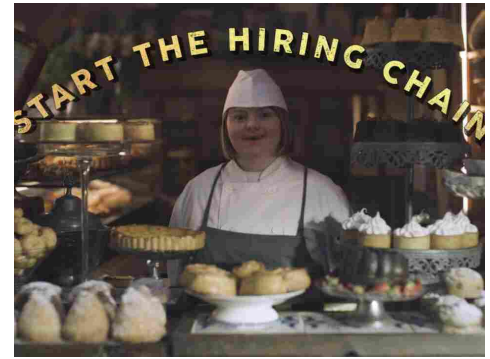
Sindrome di Down, in Ferragamo il primo assunto 'Hiring Chain' in Italia

Leroy Merlin Ã un'azienda multispecialista che offre la possibilitÃ di migliorare la propria casa grazie allâofferta di soluzioni complete di prodotti e servizi. Arrivata in Italia nel 1996, Leroy Merlin annovera ad oggi 50 punti vendita distribuiti su tutto il territorio nazionale per un fatturato di oltre 1,64 miliardi di euro. Offre lavoro a piÃ¹ di 7.000 collaboratori. Per il 99% azionisti del Gruppo stesso. Leroy Merlin crede che ogni persona abbia diritto alla propria casa ideale e si adopera per riqualificare le